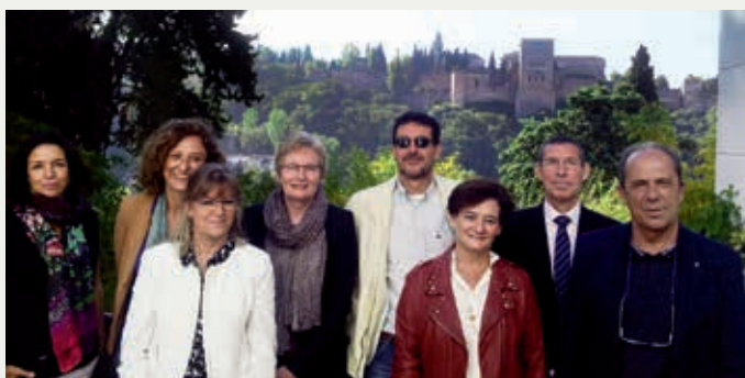
Miembros de la Comisión de Selección de las Becas de Movilidad entre universidades andaluzas e iberoamericanas en la ciudad de Granada el 22 de octubre de 2015