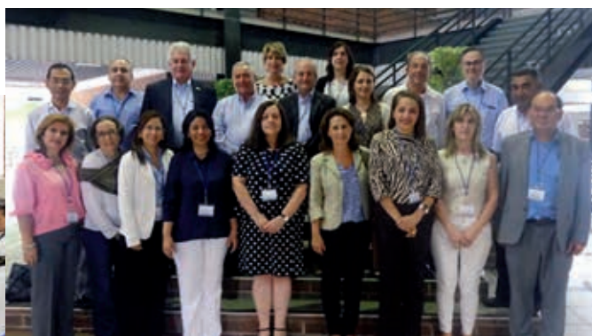
A la izquierda, sesión de trabajo de la Comisión Ejecutiva A la derecha foto de familia