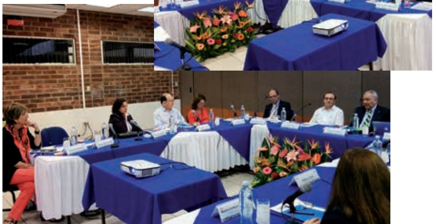
Reunión de Directores Regionales en San Salvador, 14 de octubre de 2015

Asimismo, se expusieron las aportaciones, las líneas de trabajo, los compromisos y prioridades desde el ámbito de actuación de cada una de las sedes y de sus respectivas áreas de influencia.