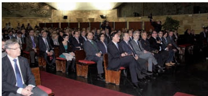
Vista general del auditorio

Rector José Carlos Gómez Villamandos, que en su intervención subrayó que las entidades premiadas representan "los ejes sobre los que quiere girar la Universidad: emprendimiento, transferencia, investigación, internacionalización, formación e información". Villamandos hizo también una reivindicación del sistema universitario público español y defendió la necesidad "de poner en valor nuestras universidades y hacer visibles las muchas fortalezas del sistema sin renunciar nunca a la mejora constante."